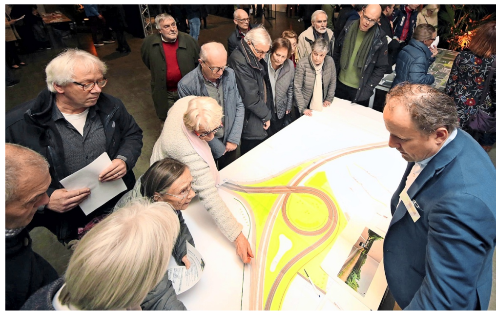
Omwonenden bekijken de plannen op de infomarkt in OC De Troubadour in Bissegem.

«We leggen geen fluisterasfalt aan, maar we laten wel drie meter hoge geluidsschermen langs de verkeerswissel zetten. Zodat geluidshinder tot een minimum wordt herleid voor huizen in onder meer de Oude Gullegemsestraat, de Koffiehoekstraat en de Zilverberkenlaan. We voorzien er ook ledverlichting, een bufferbekken voor de waterhuishouding en hagen en bomen. Belangrijk: de afrit van de Gullegemstraat naar de A19 wordt ook heraan-