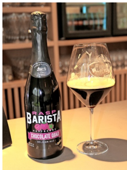
De 'Raspbarista'.

Brouwerij Van Honsebrouck lanceerde in augustus het nieuwe biertje Raspbarista speciaal voor de Amerikaanse markt, maar met de feestdagen in zicht zal het biertje nu ook hier verkocht worden.