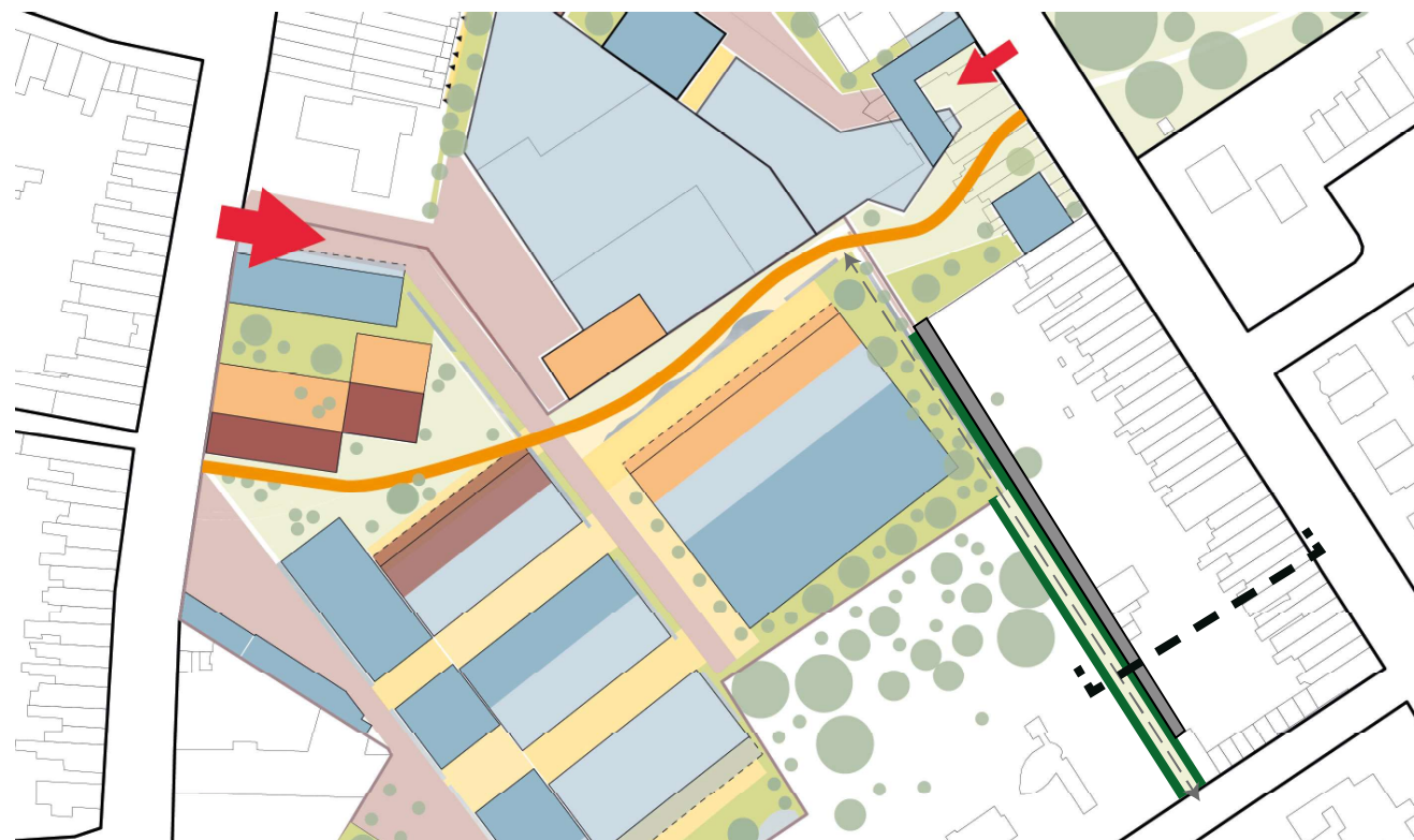
Inplantingsplan lokale voetgangers - en fietsersverbinding

De lokale voetgangers- en fietsersverbinding zal deels bestaan uit waterdoorlatende verharding en deels uit groenaanleg om de privacy van de aanpalende percelen te garanderen.