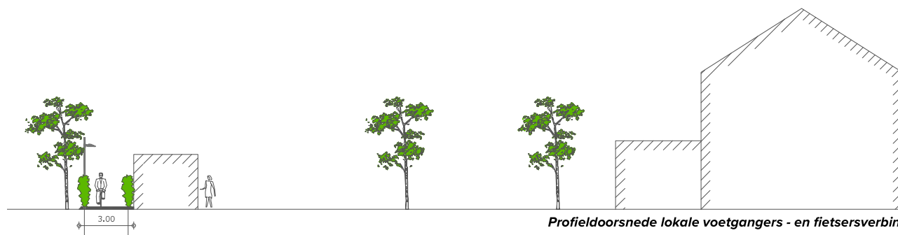
Profieldoorsnede lokale voetgangers - en fietsersverbinding