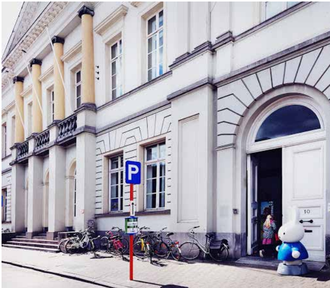
boekenhuis Theoria, Kortrijk