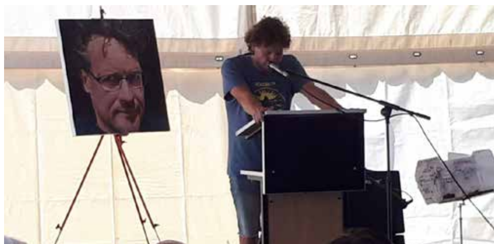
Toespraak bij zijn installatie als stadsdichter van Tilburg - 25 augustus 2019