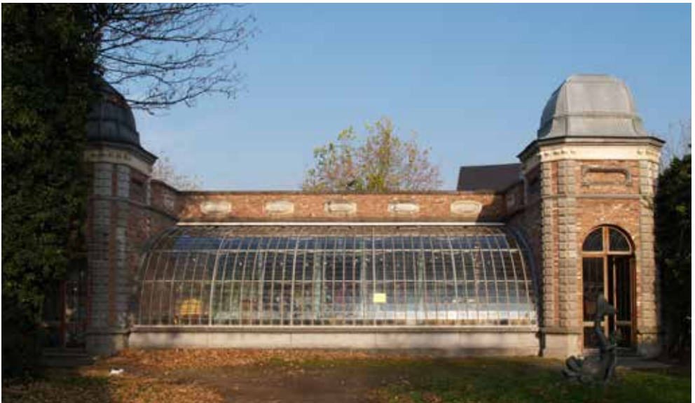
Oranjerie Broeltuin, Kortrijk