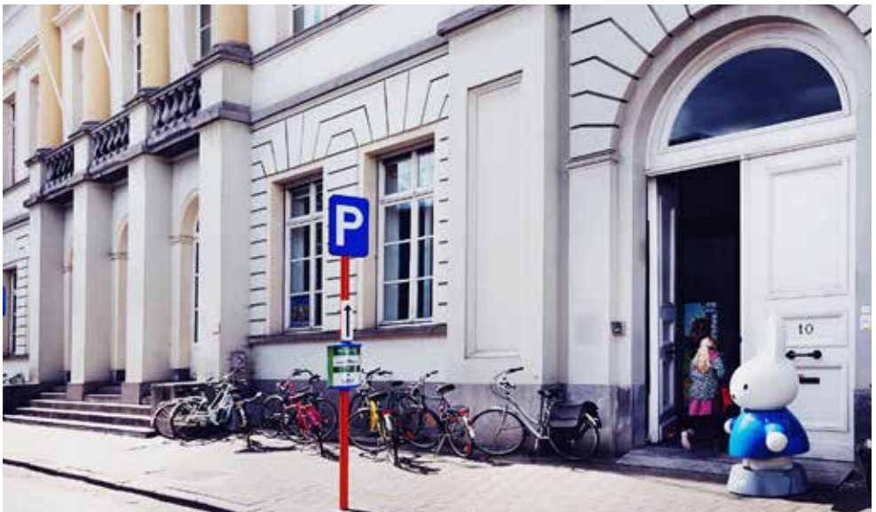
Boekenhuis Theoria, Kortrijk