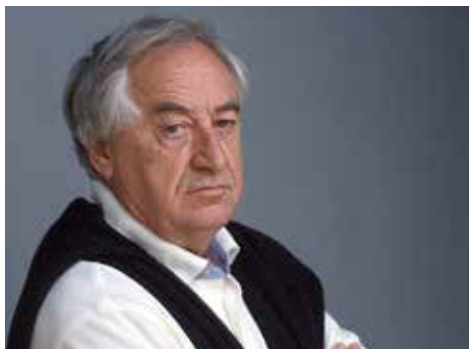
Cees Nootboom