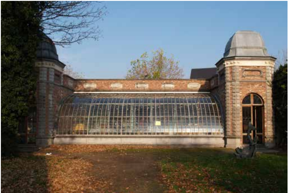
Oranjerie Broeltuin, Kortrijk