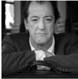
JOSSE DE PAUW