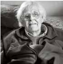
IVO MICHELIS

https://nl.wikipedia.org/wiki/Categorie:Vlaams_toneelschrijver