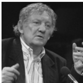
HUGO CLAUS © Rob Bogaerts