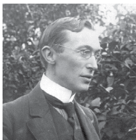
HERMAN TEIRLINCK