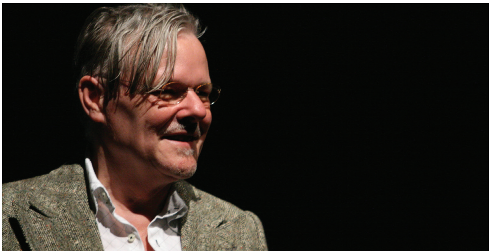
repetitiefoto 'Underground'

Van 1989 tot 1990 was hij artistiek leider van Arca Gent. Hij was ook gastdocent aan diverse theateropleidingen aan Conservatorium Gent, Conservatoire de Lille en Studio Herman Teirlinck. Sinds 1995 doceert hij aan het Rits