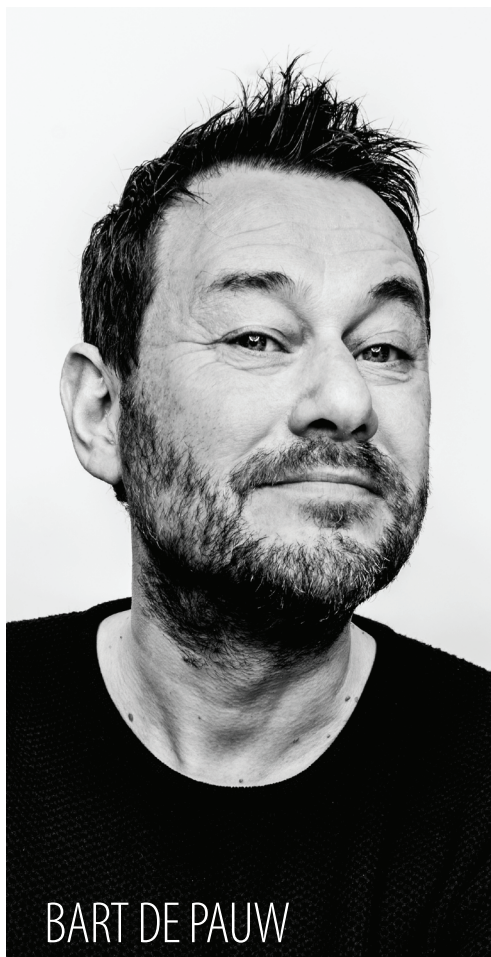
BART DE PAUW