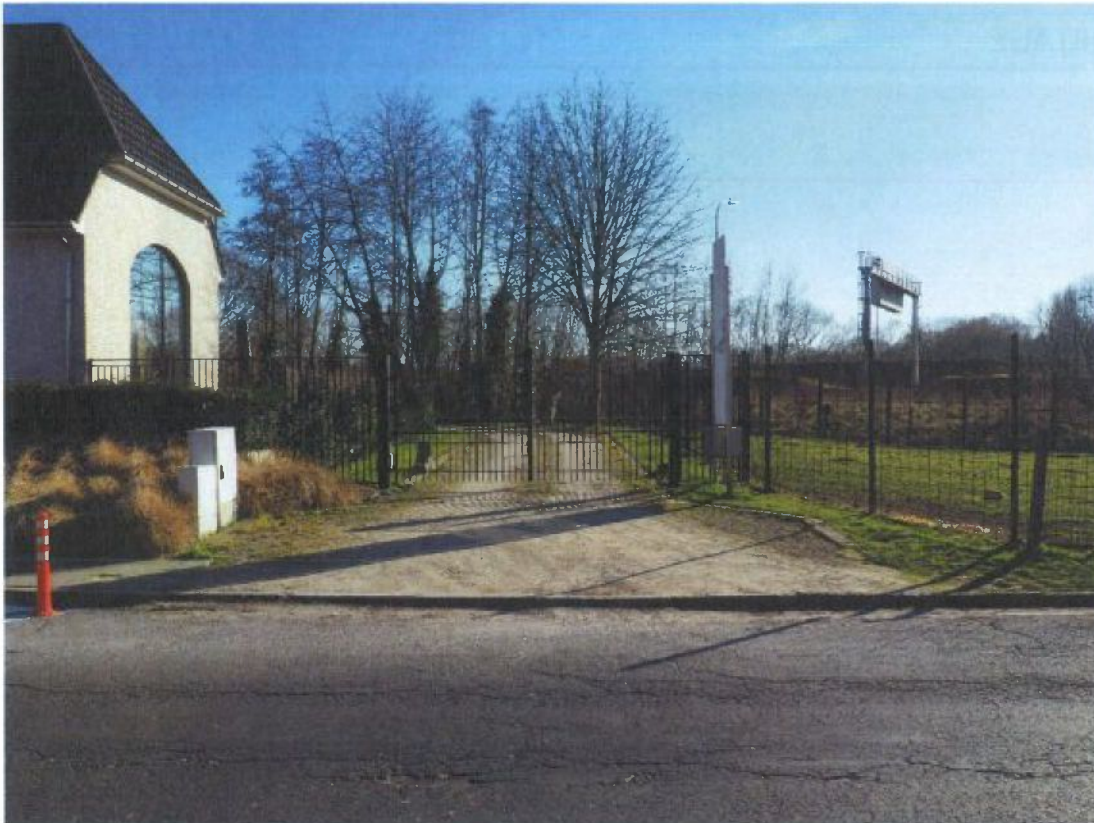
FOTO 3: Condédreef – Voetweg 65 valt samen met oprit en is onderbroken door 'het EI'