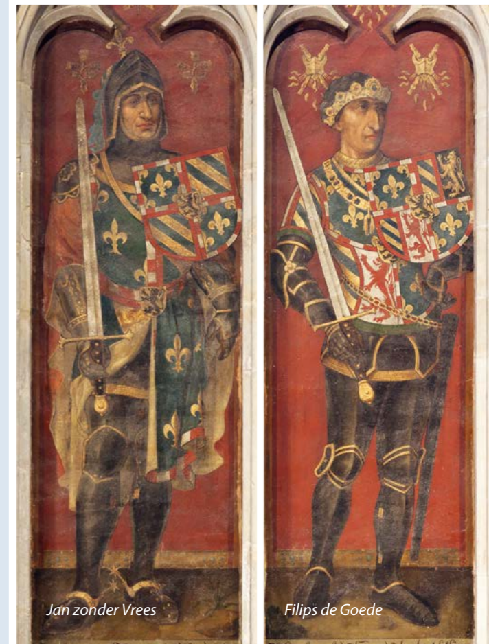
Jan zonder Vrees