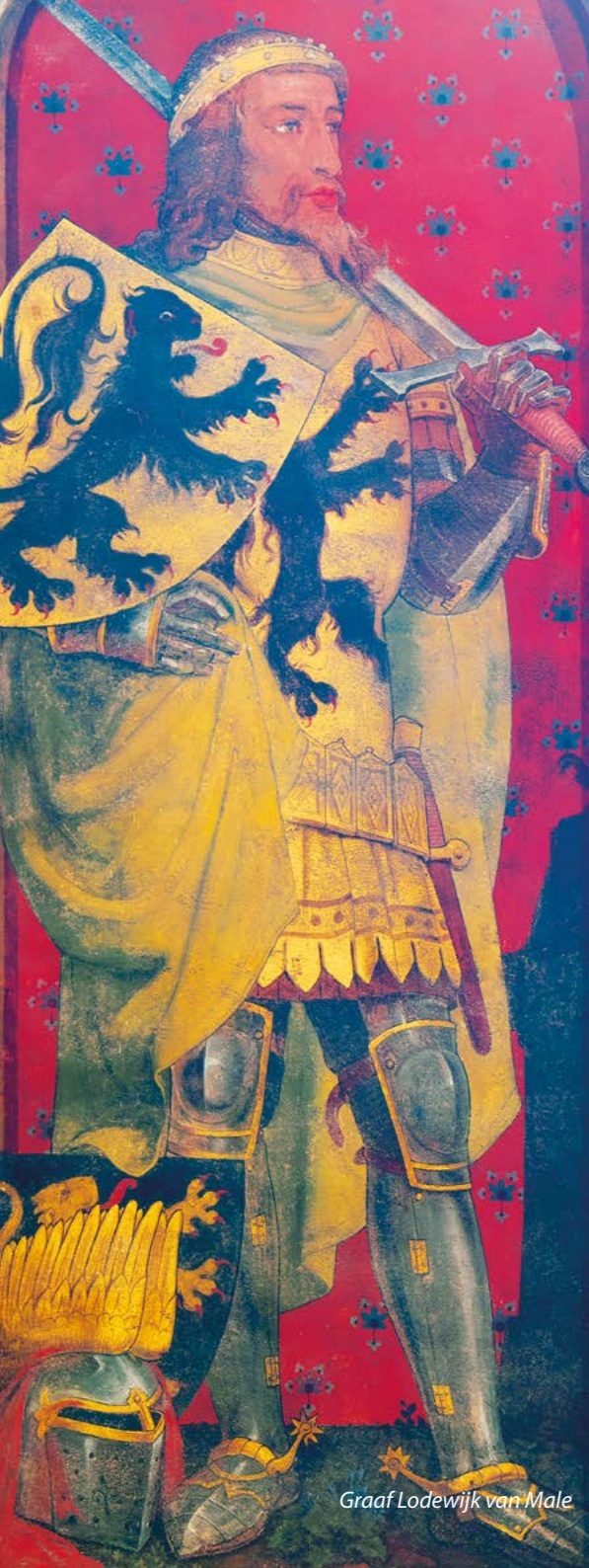
Graaf Lodewijk van Male