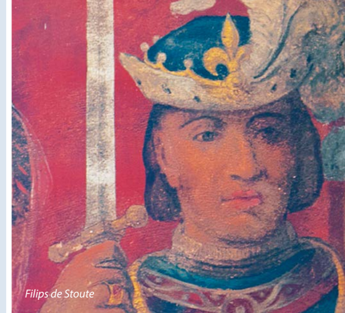
Filips de Stoute

Intussen bracht de rekenkamer van Rijsel voldoende geld binnen en hield de Orde van het Gulden Vlies de adel onder controle. Als bouwheer realiseerde Filips onder meer het kasteel van de Coudenberg in Brussel, waar hij meestal verbleef. Ook in Rijsel, Brugge, Leuven, Dijon en Gent gingen zijn bouwmeesters aan de slag. Kortom, de werken van 1446 aan de zuidelijke Broeltoren pasten helemaal in het plaatje van de pracht en praal van het Bourgondisch leven.