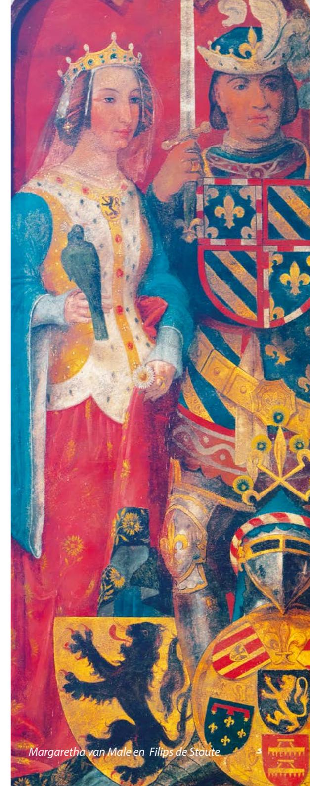
Margaretha van Male en Filips de Stoute

Ze vormden het sluitstuk voor zowel de ommuring als de omwalling van Kortrijk. Bovendien was de manier van oorlog voeren intussen ingrijpend veranderd. Werpstenen en kruisbogen hadden plaatsgemaakt voor kanonnen en handvuurwapens. Tegen het gebruik van buskruit moest je dikke muren bouwen, zonder kwetsbare hoeken. En je moest ook zelf kanonnen opstellen.