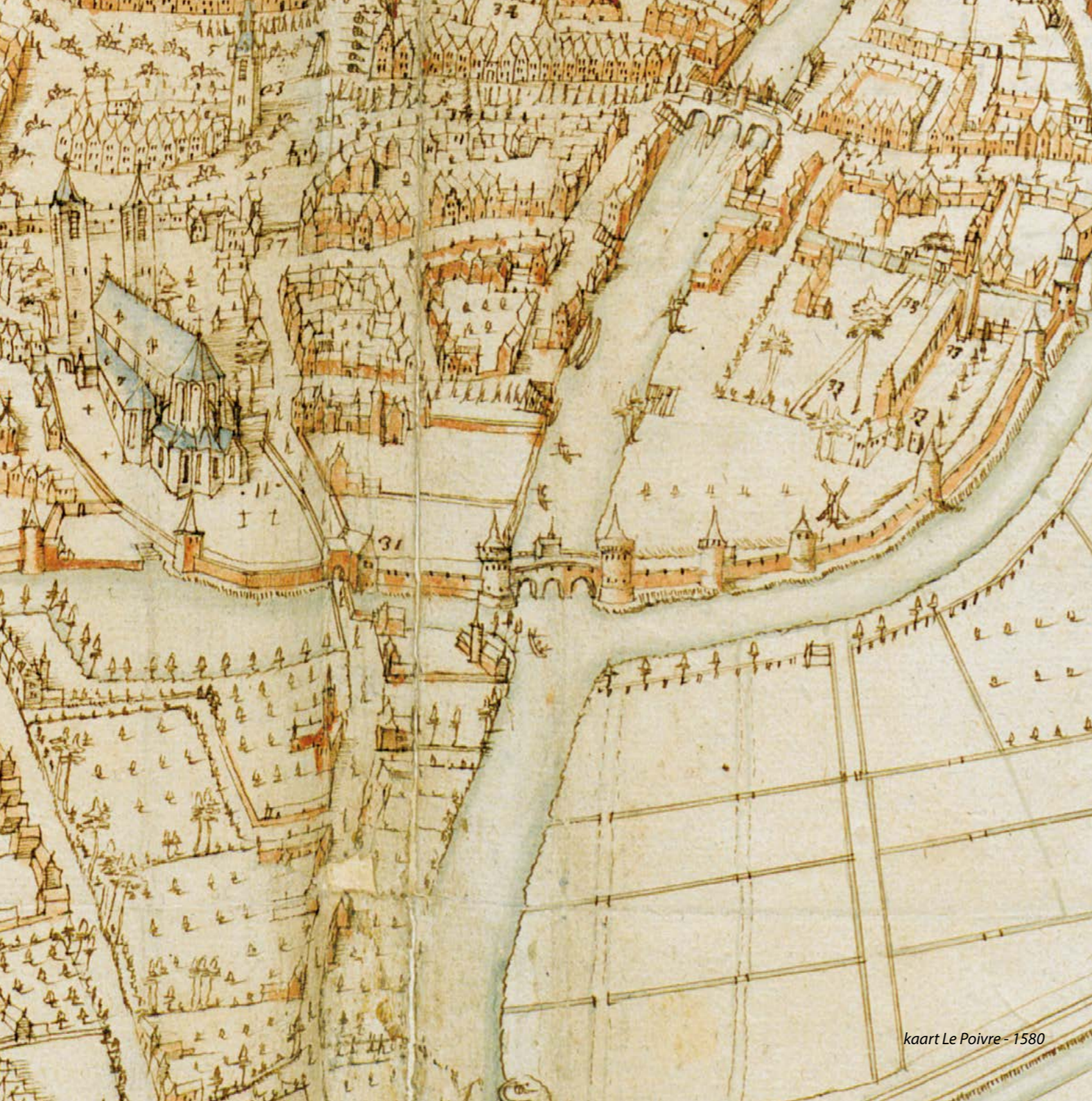
kaart Le Poivre - 1580