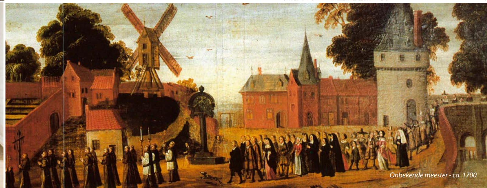
Onbekende meester - ca. 1700