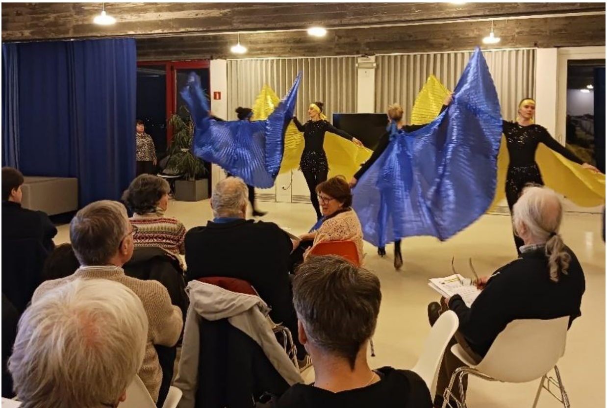
Optreden Modeshow theater