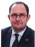
Vincent Van Quickenborne Burgemeester

We nodigen je als inwoner en/of als bezoeker uit om Kortrijk te (her)ontdekken, te beleven en mee te maken.