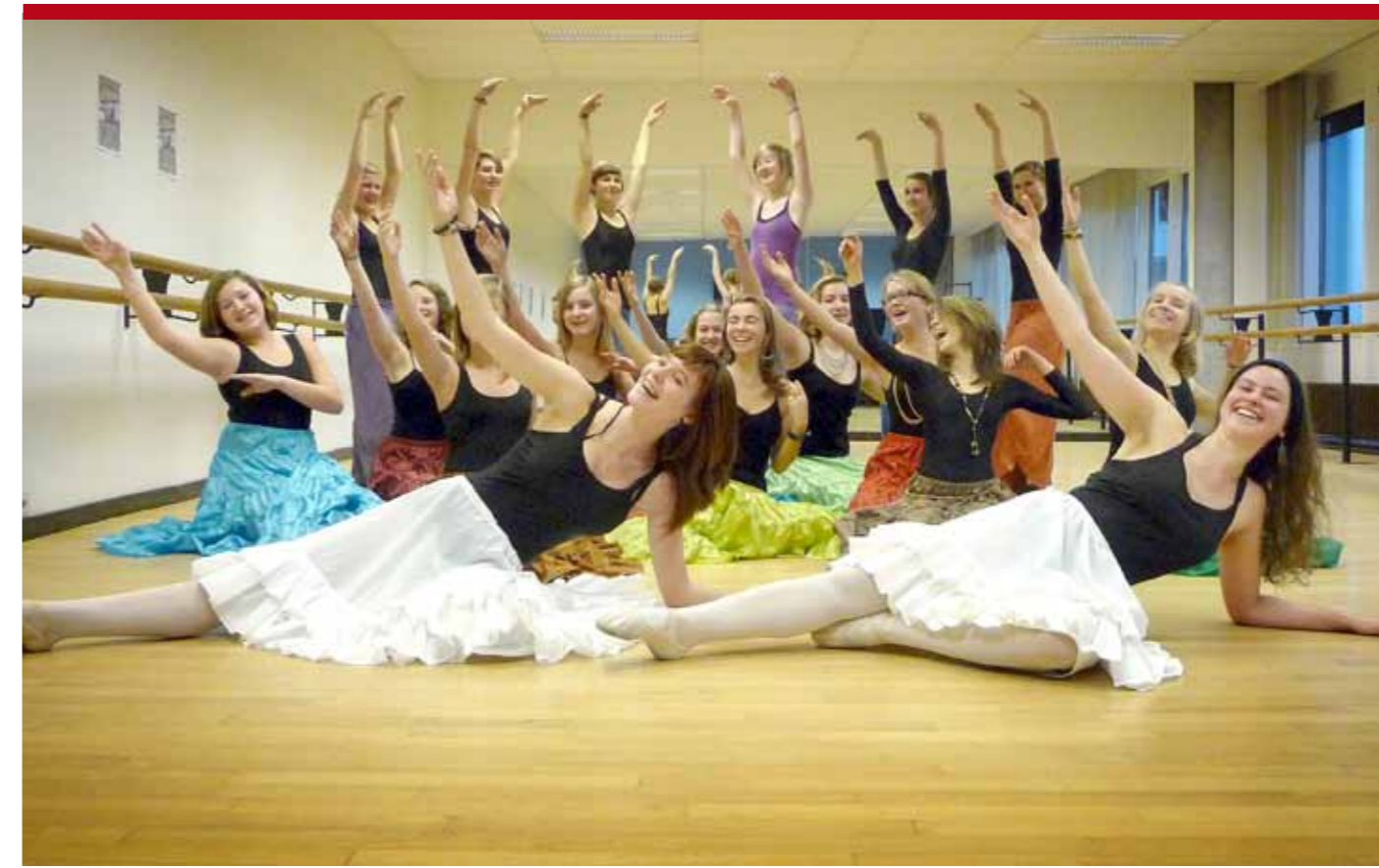
▲ Dansers uit verschillende academies zetten hun beste beentje voor.

Hou je vast aan de takken van de bomen, want op 23 en 24 januari zou de stadsschouwburg wel eens op haar grondvesten kunnen daveren. Niet verwonderlijk als driehonderd dansers uit 18 verschillende academies vraagt om letterlijk en figuurlijk hun beste beentje voor te zetten. Samen zullen ze voor de negende keer op rij hun kunnen tonen tijdens de voorstelling ‘Dansplatform’.