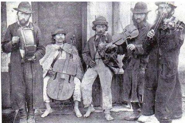
Jewish and Ruthenian musicians, Verecke, Hungary, 1895